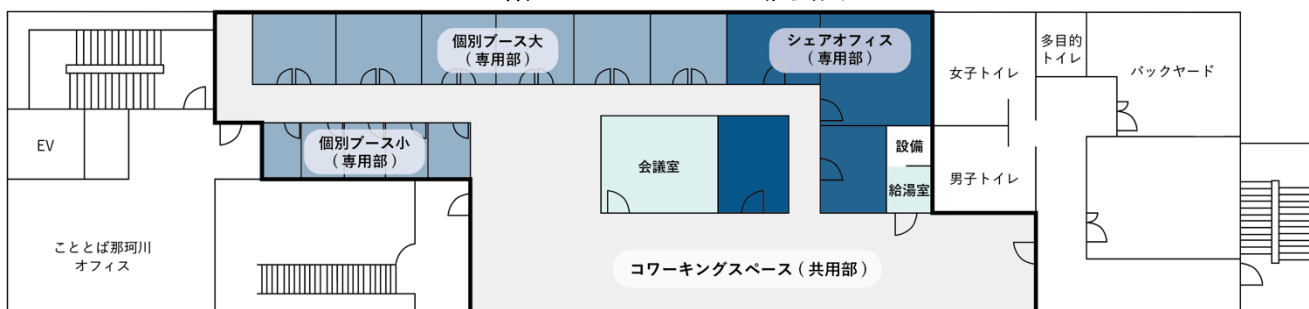
< 3階ワークスペースの概要図 >

ワークスペースは、「共用部」および「会議室」、「専用部(個別ブース、シェアオフィス)」で構成されます。共用部は「コワーキングスペース」「会議室」「給湯室」からなり、専用部は「個別ブース(大、小)」11区画、「シェアオフィス」の4区画からなります。